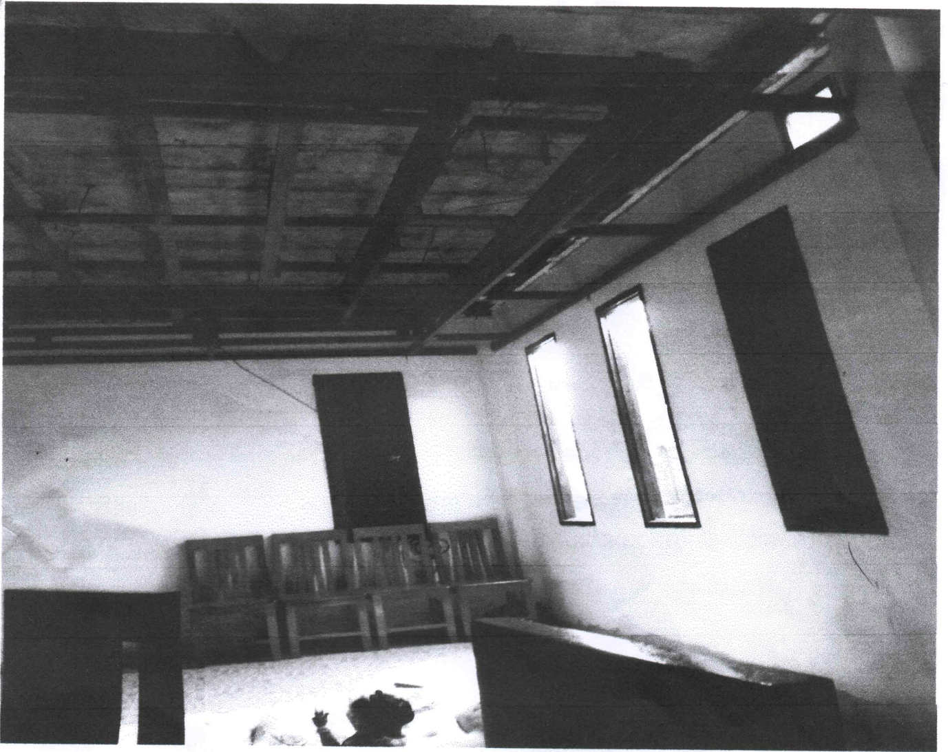
( ຮູບສະພາບປະຈຸບັນຂອງເຮືອນພາຍໃນ )